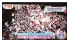
「めざましテレビ」フジテレビ

エムズシーの活動やその関係者は、「めざましテレビ」や「ZIP!」といった全国ネットのTV番組をはじめ、これまでに数多くのTVや新聞、雑誌、ラジオといったマスメディアで紹介させて頂いています。またTVQ様では、福岡県庁の広報番組「飛び出せ! サークルふくおか研!」のレギュラーリポーターを4年間に渡り務めさせて頂き、LOVE FM様でも「After School Music」、「Campus Beats」といった番組で、10年以上に渡りレギュラー番組を持たせて頂いています。