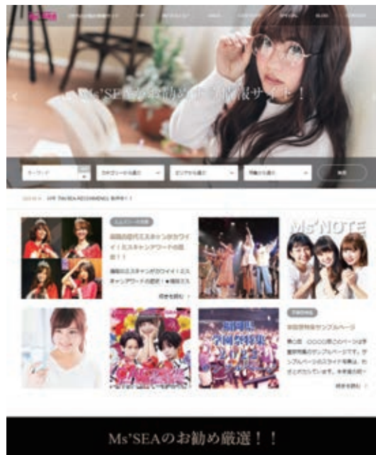
(エムズネットレコメンド https://recommend.mssea.net/ )