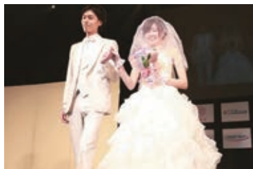
●ウェディングステージ