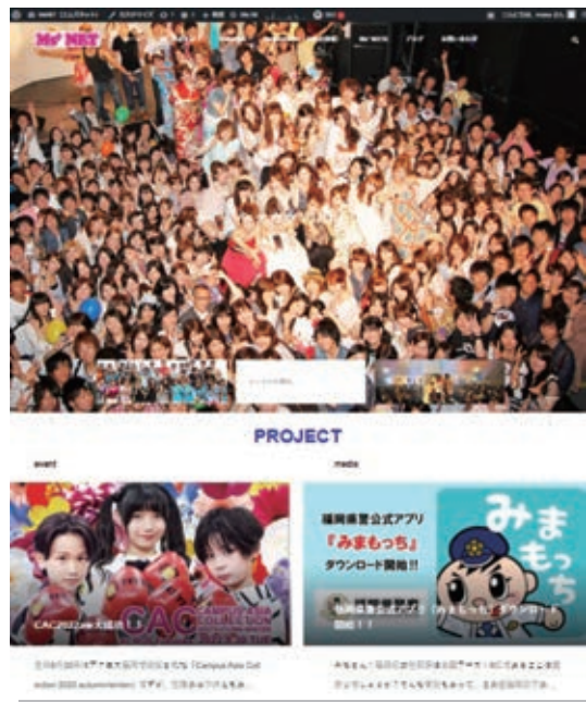
(エムズネット https://mssea.net/ )

エムズシーが運営している公式サイトが『エムズネット』、その中でも『Z世代へのおススメ情報』に特化しているポータルサイトが『エムズネットレコメンド』です。福岡の学生におススメの企業やアルバイトの紹介、サークルや学園祭の紹介などを行っています。これから福岡の学生間、そして企業と学生のネットワークを構築できるように励んでいきたいと考えています。