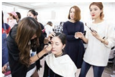
●ヘアメイクブース