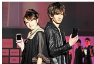
●モバイルステージ